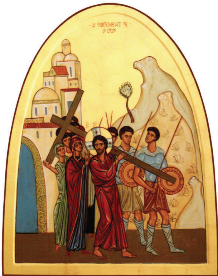
Quatrième mystère : LE PORTEMENT DE CROIX Marc 15,20-22

Ils l'emmènent pour le crucifier, et ils réquisitionnent, pour porter sa croix, un passant, Simon de Cyrène, le père d'Alexandre et de Rufus, qui revenait des champs. Et ils amènent Jésus au lieu dit Golgotha, ce qui se traduit : Lieu-du-Crâne (ou Calvaire).