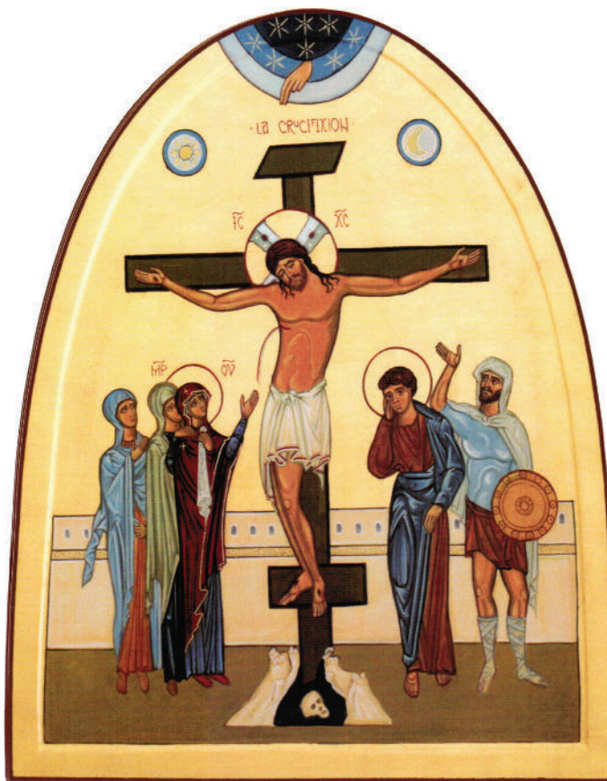
Cinquième mystère : JÉSUS MEURT SUR LA CROIX Marc 15,24-29

Ils l'emmènent pour le crucifier, et ils réquisitionnent, pour porter sa croix, un passant, Simon de Cyrène, le père d'Alexandre et de Rufus, qui revenait des champs. Et ils amènent Jésus au lieu dit Golgotha, ce qui se traduit : Lieu-du-Crâne (ou Calvaire).