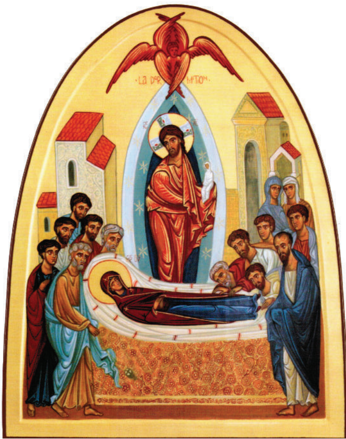
Quatrième mystère : L'ASSOMPTION Jean 17,22-24

Jésus pria son Père : « Je leur ai donné la gloire que tu m'as donnée, pour qu'ils soient un comme nous sommes UN : moi en eux, et toi en moi.