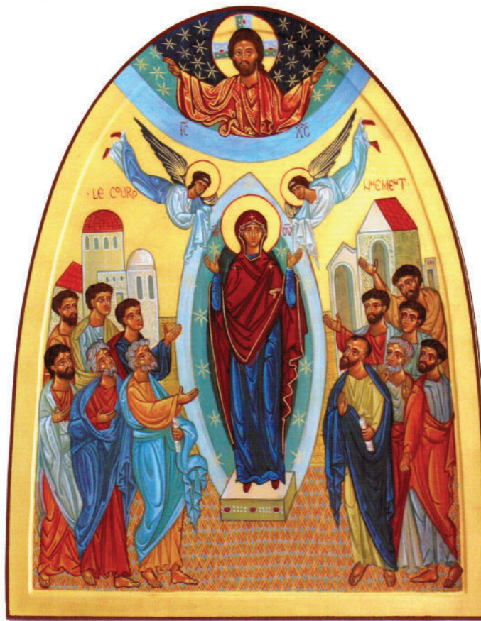
Cinquième mystère : LE COURONNEMENT DE MARIE Luc 1,41-55

Père, ceux que tu m'as donnés, je veux que là où je suis, ils soient eux aussi avec moi, et qu'ils contemplent ma gloire, celle que tu m'as donnée parce que tu m'as aimé avant la fondation du monde. »